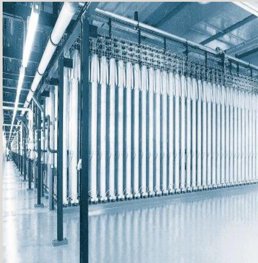
Hala wirówek w zakładzie wzbogacania uranu